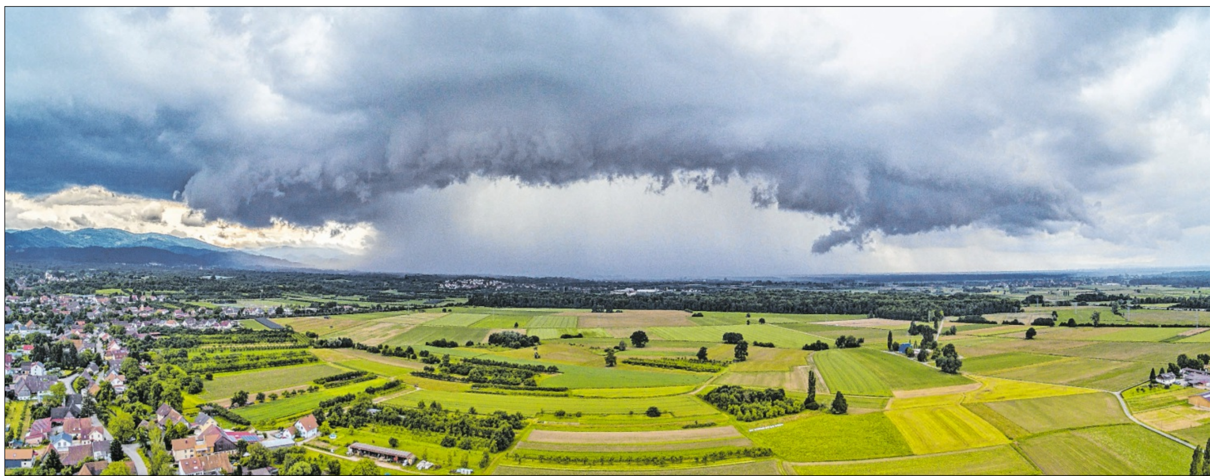
Vor dem Regen: Das unbeständige Wochenendwetter hat ABB-Leser Manuel Glaser zu dieser Aufnahme inspiriert: Er ließ am Samstagmittag bei Fautenbach seine Drohne steigen. Sein Bild zeigt den Blick in Richtung Süden.