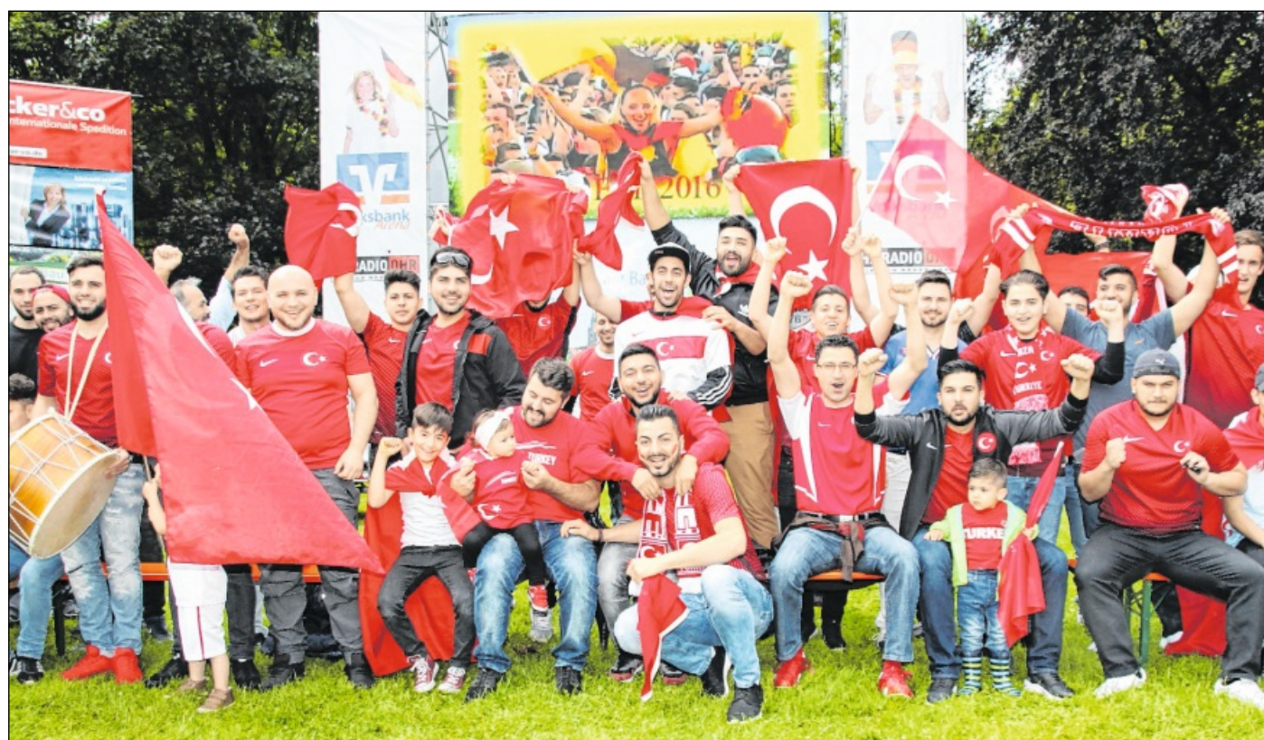
RUND 200 TÜRKISCHE FANS feuerten gestern im Acherner Stadtgarten ihre Mannschaft an. Am Ende gab es freilich einen 1:0-Sieg für Kroatien.

Sicher ist, dass die Veranstalter von „Achern aktiv“ und deren Partnern die besten Voraussetzungen geschaffen haben, damit sich die Fans auf dem grünen Rasen des Stadtgartens wohl fühlen. Wie in den Vorjahren gibt es auch einen separaten VIP-Bereich für Privatpersonen, Gruppen, Vereine und Firmen. Reservierungen sind über die Internetseiten von „Achern aktiv“ möglich. Wie das Auftaktspiel der deutschen Mannschaft gestern Abend werden an den Spieltagen der deutschen Elf auch die anderen Spiele des jeweiligen Tages übertragen. ■ Sport